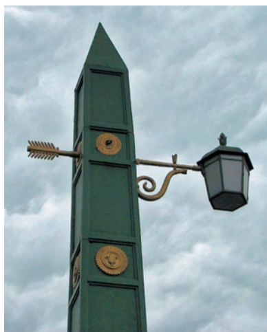
Фонарь на обелиске Египетского моста