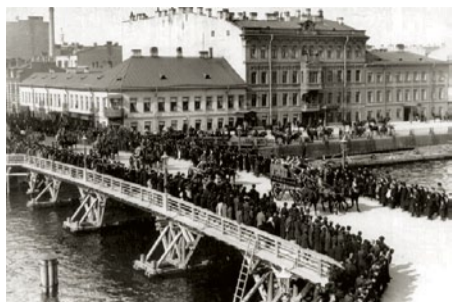
Временный деревянный мост, построенный после разборки цепного Египетского моста

Только в 1954–1955 годах новый металлический однопролетный мост связал берега Фонтанки по оси Лермонтовского проспекта. Этот мост, выстроенный