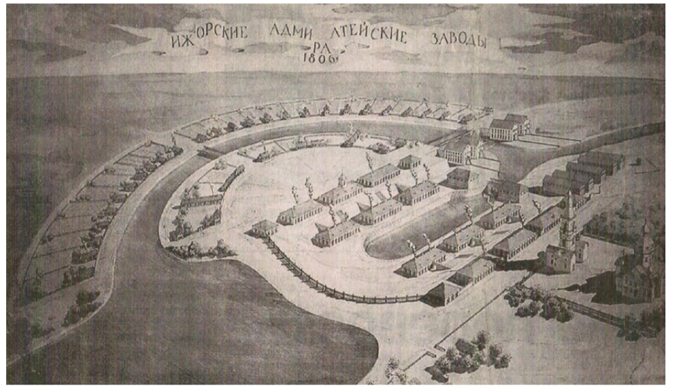
Ижорские заводы, гравюра, 1806 год

Адмиралтейские Ижорские заводы, основанные по указу Петра I в селении Колпино на реке Ижоре, к началу XIX века пришли в упадок и находились на грани разрушения из-за постоянных нововведений. В 1803 году под руководством Карла Гаскойна началась капитальная реконструкция старинных заводов. Были возведены новые производственные корпуса по типовому проекту архитектора В. Гесте. Особое внимание уделялось строительству каналов, плотин, сооружению бассейна. Уникальная водная система определила не только планировку возрожденного предприятия, но и своеобразный облик расположенно-